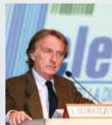
L. C. di Montezemolo